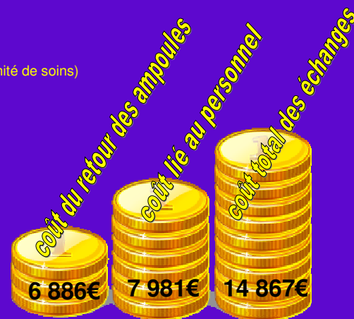
Figure 2 : évaluation des coûts (euros)